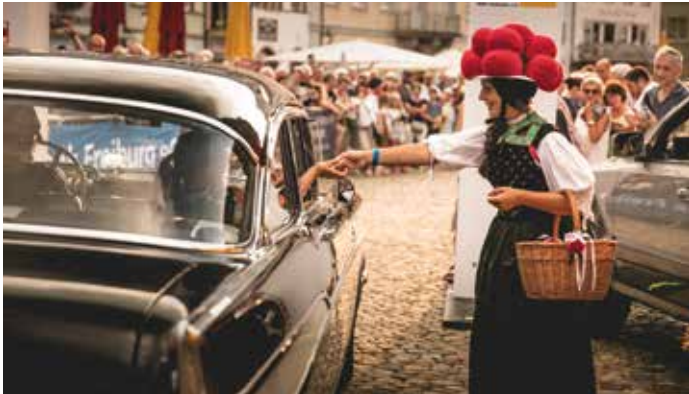
Höhepunkt: Immer wieder ein unglaublich schönes Bild – die Einfahrt der Oldtimer auf dem historischen Münsterplatz in Freiburg am Freitagabend.