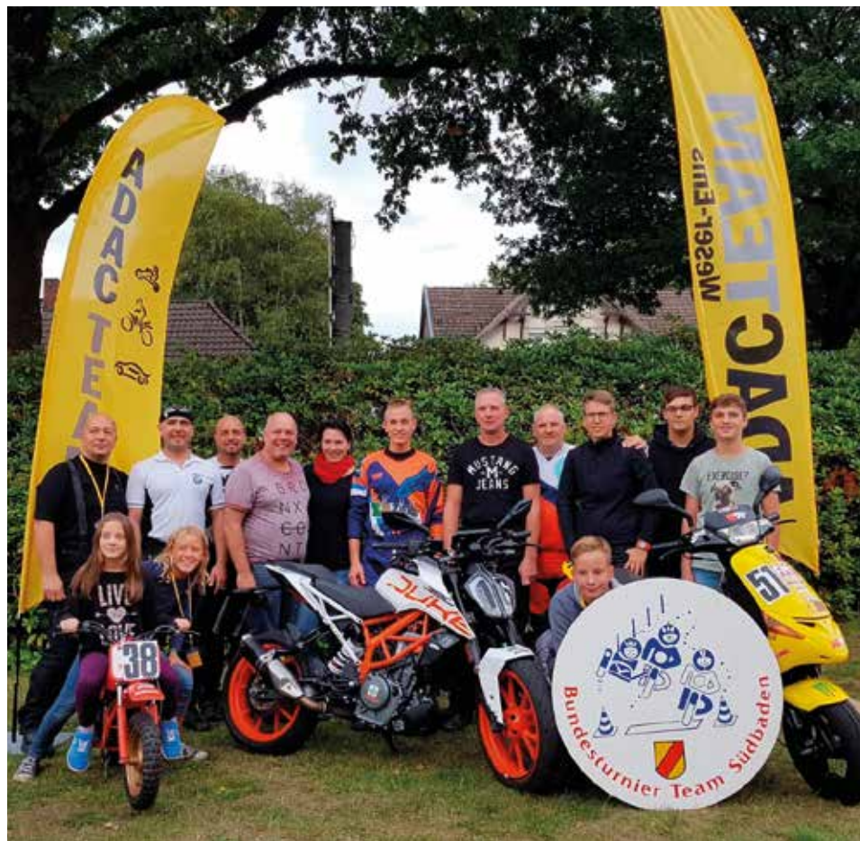
Siegertypen: Die erfolgreichen Motorrad-Fahrer des ADAC Südbaden.