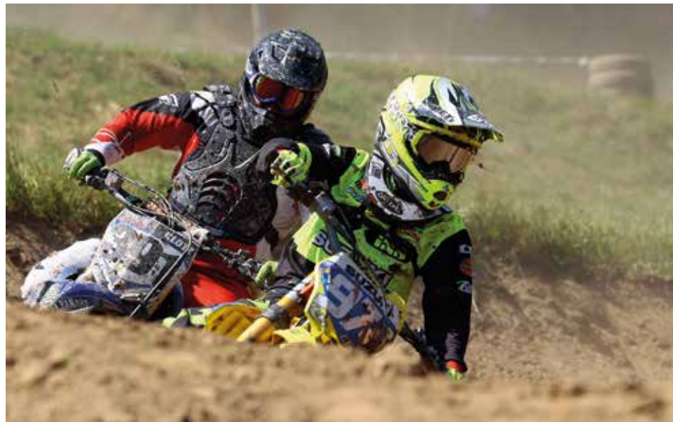
Ja wo stecken sie denn? Beim 45. Motocross staubte es gewaltig.

Mit 98 Startern beim Motocross am Sonntag war die 45. Auflage absolut rekordverdächtig. Zwei Klassen, 85 ccm und 250 ccm, wurden zur Deutschen Meisterschaft gewertet, das Startgitter bei allen sechs Wertungsläufen voll besetzt, was für die Zuschauer besonderer Nervenkitzel bedeutete.