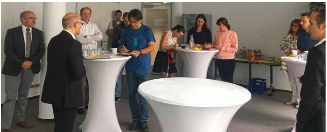
Volles Haus: Das Medieninteresse am Pendlernetz war bei der Pressekonferenz gewaltig. Gleich sieben Journalisten kamen in das ADAC Gebäude am Predigertor 1 in Freiburg.

Betreiber des Pendlernetz Südbaden ist fahrgemeinschaft.de GmbH. Gemeinsam mit dem ADAC ist fahrgemeinschaft.de in Deutschland führender Anbieter von Pendlerangeboten auf Strecken unter 100 km.