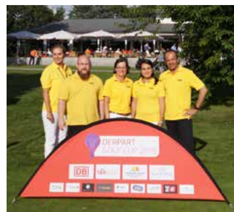
Hole-in-one: Dieser bei den Golfern äußerst beliebte Schlag galt für das gesamte Turnier, das DERPART auch 2018 deutschlandweit ausgeschrieben hatte. Auch das Freiburger Reisebüro des ADAC Südbaden hatte sich als eines von 14 daran beteiligt. 75 Teilnehmer waren auf die Anlage des Freiburger Golfclubs gekommen – und restlos begeistert. Ganz besonders freuen konnten sich die Sieger Brutto und Netto A, B und C. Sie reisen nämlich vom 25. bis 28. Oktober nach Mallorca in das Zafiro Hotel Alcudia, um dort das Finalturnier auszuspielen.