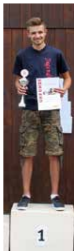
Bilder: Rafael Kürz