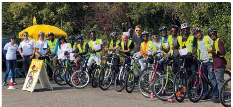
„Ja – mir san mim radl da“: Perfekt ausgerüstet mit Helm, Brille und Sonnenschutz wurde die Fahrradschulung für Flüchtlinge durchgeführt.

Helmpflicht und Sonnenschutz waren Pflicht – und wurden gestellt.