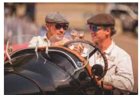
Prost: Diese beiden stoßen auf eine wieder einmal rundum gelungene Rallye an.