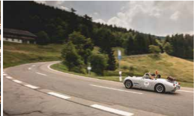
Höhenluft: Die ehemalige Bergrennstrecke am Schauinsland bietet den Fahrern stets ein atemberaubendes Ambiente.